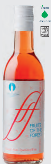
ΦΡΟΥΤΑ ΤΟΥ ΔΑΣΟΥΣ

ΠΟΙΚΙΛΙΑΚΟΣ ΟΙΝΟΣ ΡΟΖΕ ΓΛΥΚΥΣ ΑΦΡΩΔΗΣ — 187ml —