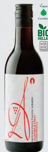
ΚΑΡΥΟΣ ΓΗ ερυθρός

ΠΟΙΚΙΛΙΑΚΟΣ ΟΙΝΟΣ ΕΡΥΘΡΟΣ ΞΗΡΟΣ — 187ml —