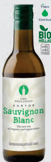
ΚΑΡΥΟΣ ΓΗ λευκός

ΠΟΙΚΙΛΙΑΚΟΣ ΟΙΝΟΣ ΟΙΝΟΣ ΛΕΥΚΟΣ ΞΗΡΟΣ — 187ml —