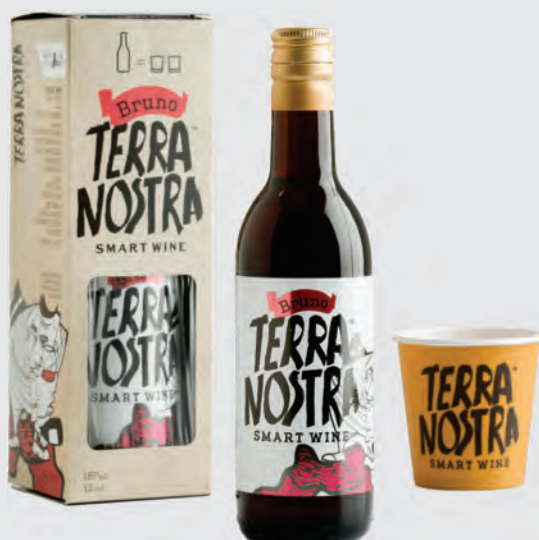
TERRA NOSTRA ΕΡΥΘΡΟΣ