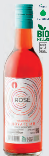
ΚΑΡΥΟΣ ΓΗ ροζέ