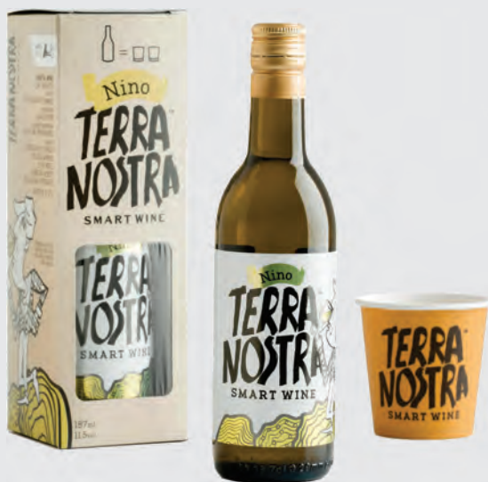
TERRA NOSTRA ΛΕΥΚΟΣ