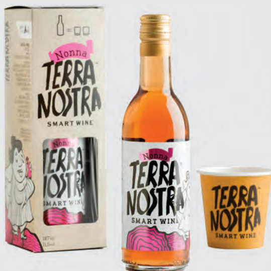
TERRA NOSTRA ΡΟΖΕ

Σε μοναδική συσκευασία μαζί με ένα ποτήρι craft.